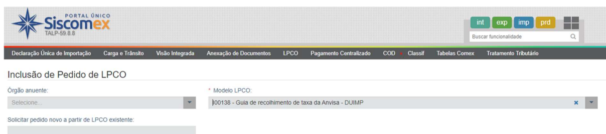
Figura 1 – Guia de Taxa Anvisa

O modelo de LPCO específico para a Guia de taxa Anvisa é o I00138 – Guia de recolhimento de taxa da Anvisa – DUIMP (figura 1)