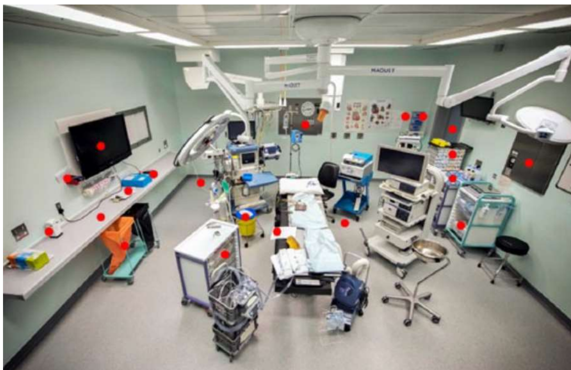
Figura 4. Ambiente assistencial indicada por pontos vermelhos (Smith F, 2019).

Assim, exemplos dos cinco momentos de HM relacionados ao paciente cirúrgico, estão descritos a seguir e que se referem também à unidade de RPA (AORN, 2023; AORN, 2024):