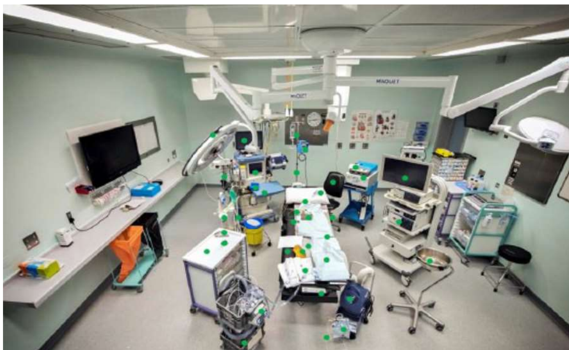
Figura 3. Ambiente do paciente indicada por pontos verdes. (Smith F, 2019).

Entretanto, cada instituição deve constituir uma equipe multidisciplinar e avaliar os procedimentos realizados no Centro Cirúrgico (incluindo na SO) e RPA para definir o ambiente do paciente e ambiente assistenciais, as indicações dos 5 momentos, em especial, o fluxo de trabalho do anestesiolegista.