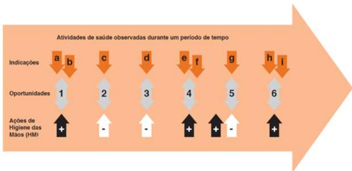
Figura 6. Ligação entre indicação, oportunidade e ação de HM.