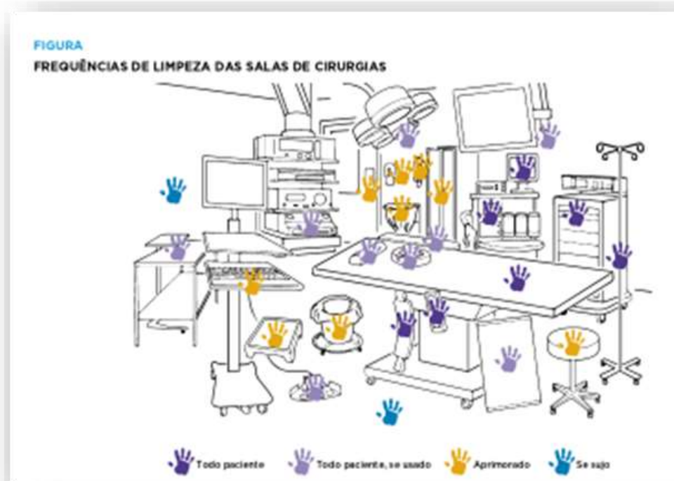
Figura 5. Superfícies mais tocadas pelas mãos na Sala Operatória.